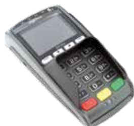
Pinpad IPP350 (2)