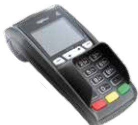
Betaalautomaat ICT250 (1)